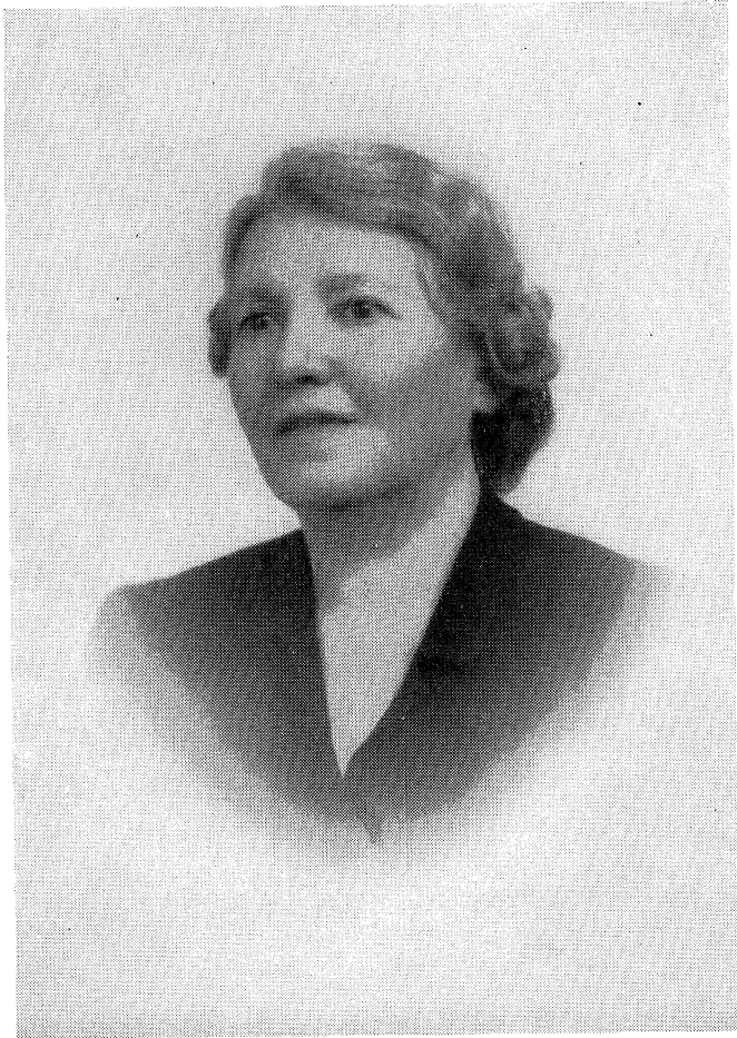
מיין פרוי פאַטאַגראַפֿירט אין יאָר 1951